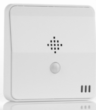
Sensor de movimiento multibox