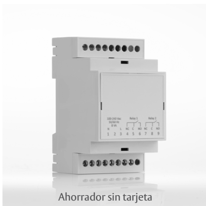
Ahorrador sin tarjeta