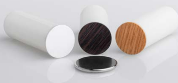
Sensor de puerta-ventana empotrado