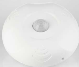
Sensor de movimiento superficie