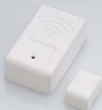
Sensor de puerta-ventana superficie