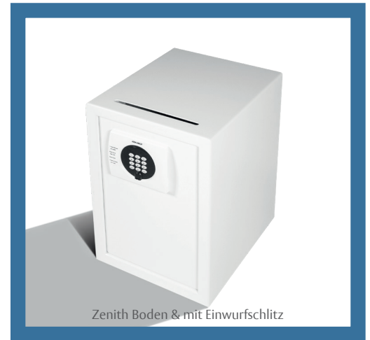
Zenith Boden & mit Einwurfschlitz